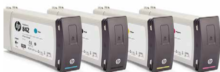
8 cartouches (2 x 775 ml par couleur avec changement automatique)